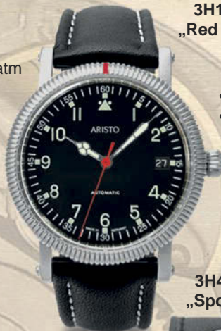
3H197 „Red Dot“