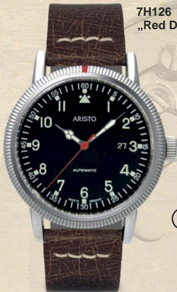
7H126 „Red Dot“