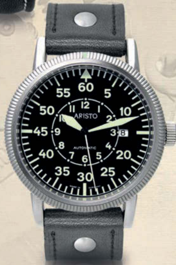
auch mit Leuchtzifferblatt 3H42 erhältlich

auch als Beobachter 3H57A und Navigator 3H59A erhältlich