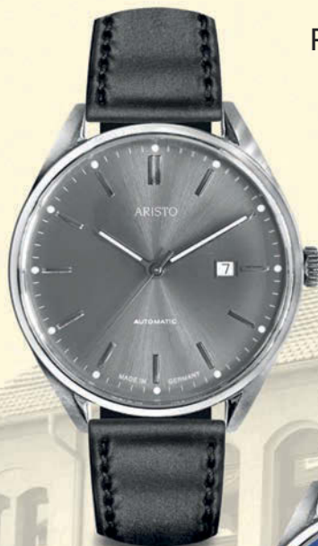
Titan- Sonnenschliff 4H213-S